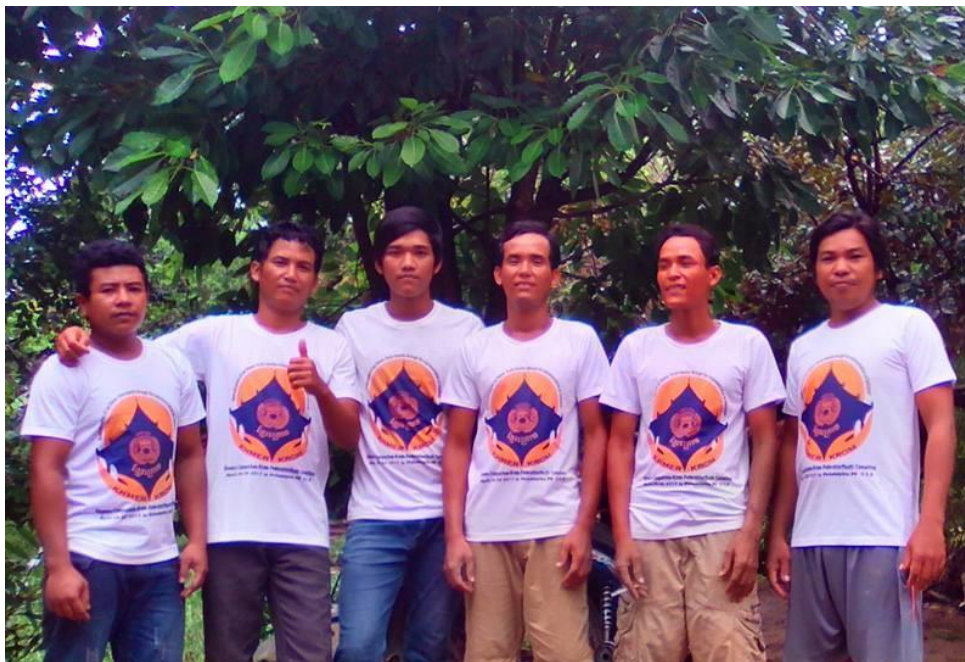
ក្រុមយុវជនភូមិមេរងថ្មី ពាក់អាវយឺតខ្មែរក្រោម ថ្ងៃទី ២២ ខែឧសភា ឆ្នាំ ២០១៧ ។