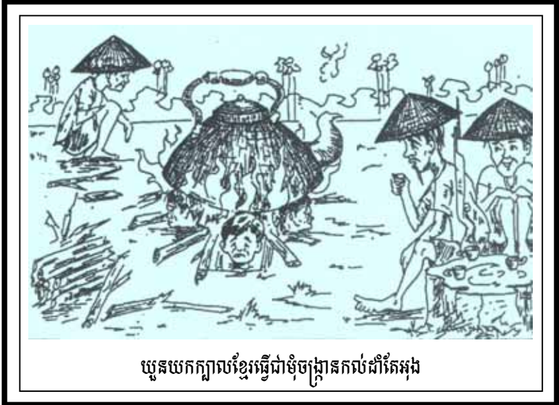
យួនយកក្បាលខ្លួនធ្វើជាមុំចង្រ្កានកល់ដាំតែអង្គ

៨៣៩-ឯអស់រាស្ត្រទាំងឡាយ រត់ប្រញាយ ទៅទីទេ ទៅរកពួនក្នុងព្រៃ ពីងប្រាស្រ័យកម្លាំងកាយ ។ ៨៤០-កំពង់ស្ងៀមជើងព្រៃ សឹងភិតភ័យពុំ សប្បាយ រៀងរាល់ទាល់បារាយណ៍ កំពង់ស្វាយដែលដូចគ្នា ។ ៨៤១-រីឯខេត្តបារាយណ៍ រត់ប្រញាយឡើង ចំការ ព្រៃធំដុំជិតគ្នា ខ្លះនៅនាក្បាលទឹកហូរ ។ ៨៤២-មានកាលថ្ងៃមួយនោះ