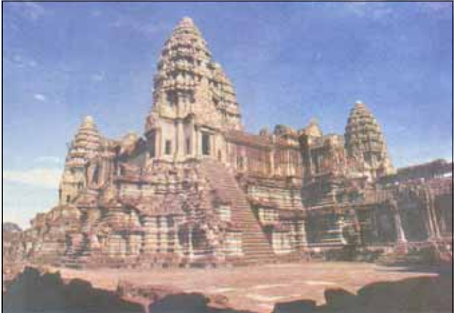
ប្រាសាទអង្គរវត្តជាន់ទី ២ ជាផ្នែកមួយនៃប្រាង្គអ្នកទេសចរនៅគគលើ

ប្រាសាទអង្គរវត្ត គឺជាសម្បត្តិវប្បធម៌ដ៏វិសេសវិសាលរបស់ជាតិសាសន៍ខ្មែរ ដែលបានកសាងឡើងនៅសម័យមហានគរជ័ររុងរឿង ក្នុងគោលបំណងឧទ្ទិសថ្វាយចំពោះព្រហ្មញ្ញសាសនា ហើយនៅសម័យក្រោយ ៗ មកទៀតទីនោះបានប្រែក្លាយជាវត្តអារាម សម្រាប់គោរពបូជាចំពោះព្រះពុទ្ធសាសនាវិញ ។ ប្រាសាទកំពូលប្រាំដែលមានស្រះបោក្រូរណីព័ទ្ធជុំវិញមានទឹកថ្លាឈូងមើលឃើញឆ្លុះបាតដី ហើយសំណង់ប្រាសាទមានក្បូរក្បាច់រចនាល្អឆើតឆាយទឹកដៃខ្ពស់រស់រវើកបង្ហាញពីការរីកចម្រើនផ្នែកវប្បធម៌សិល្បៈ និងសំណង់ដល់កម្រិតកំពូលព្រមទាំងបានទាក់ទាញភ្ញៀវទេសចរជាតិ អន្តរជាតិចម្រុះជាតិសាសន៍ ឲ្យទៅទស្សនាកំសាន្តយ៉ាងច្រើនសន្លឹកសន្លាបលើសប្រាសាទនានាទូទាំងខេត្តសៀមរាប ។ ប៉ុន្តែអ្វីដែលចម្លែក ធ្វើឲ្យអារម្មណ៍អ្នកទេសចរមិនអាចភ្លេចទៅកំសាន្តនោះ គឺកន្លែងប្រាសាទកក់ទ្រូង ដែលពួកគេនាំគ្នាឈរផ្នែកខ្នងជាប់នឹងជញ្ជាំង ហើយក្តាប់ដៃគគលើដើមទ្រូងមានសូរសម្លេងប្លែកពីធម្មតាខ្លីរពញ្ជើដើមទ្រូង បង្កើតជាចម្ងល់ជាប់មិនដាច់ ហើយទីនោះមានរឿងនិទានជាច្រើនខុសគ្នា តែបង្ហាញនូវអត្ថន័យតែមួយដែលទាក់ទងទៅនឹងប្រាសាទ ។