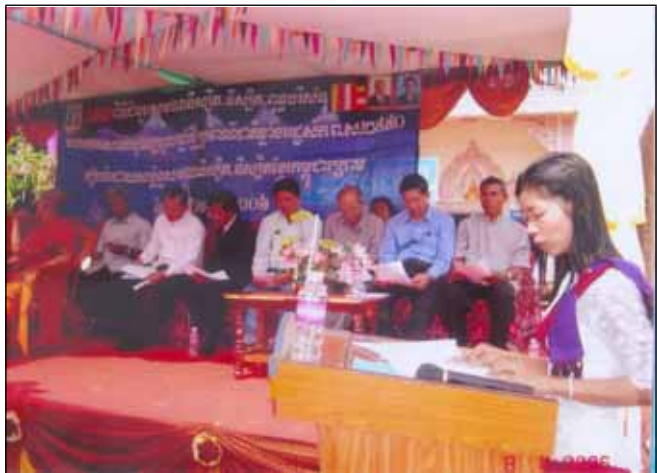
គណៈអធិបតីក្នុងពិធីជំនួបសម្ព័ន្ធសមណានិស្សិត និស្សិតខ្មែរកម្ពុជាក្រោម

រៀកក្នុងឱកាសដ៏ប្រពៃនៃជំនួបសមណានិស្សិត និស្សិត និងពុទ្ធបរិស័ទខ្មែរកម្ពុជាក្រោម ដែលរៀបចំឡើងដោយសម្ព័ន្ធសមណានិស្សិត-និស្សិតខ្មែរកម្ពុជាក្រោម ដើម្បីអបអរសាទរចូលឆ្នាំថ្មីប្រពៃណីជាតិខាងមុខនេះ ។ នាងខ្ញុំតាំងនាមឲ្យនិស្សិតខ្មែរកម្ពុជាក្រោមទាំងអស់ ដែលកំពុងរស់នៅឯកម្ពុជាក្រោម នៅព្រះរាជាណាចក្រកម្ពុជា ក៏ដូចជានៅបណ្តាប្រទេសលើពិភពលោក ។ សូមថ្លែងអំណរគុណយ៉ាងជ្រាលជ្រៅចំពោះឯកឧត្តម លោកជំទាវ អស់លោក លោកស្រី បងប្អូននិស្សិតទាំងអស់ដែលបានអនុញ្ញាតឲ្យនាងខ្ញុំបានឡើងមកធ្វើចំណាប់អារម្មណ៍ពីសកម្មភាព ទិដ្ឋភាពនៃការសិក្សា និងរាល់ការចូលរួមការងារសង្គមរបស់សមណានិស្សិត-និស្សិតខ្មែរកម្ពុជាក្រោម កន្លងមក និងកំពុងបន្តរួមចំណែកនាពេលអនាគត ។ ជាពិសេសចំពោះការផ្តើមគំនិតឲ្យមានថ្ងៃនេះឡើងរបស់សម្ព័ន្ធសមណានិស្សិត-និស្សិតខ្មែរកម្ពុជាក្រោមយើង ក្រោមការជួយជ្រោមជ្រែងរបស់អង្គការសមាគមខ្មែរកម្ពុជាក្រោមក្នុង និងក្រៅប្រទេស ពុទ្ធបរិស័ទគ្រប់ទិសទី ។ ចាប់តាំងពីនាងខ្ញុំព្រះករុណាយើងខ្ញុំទាំងអស់គ្នា បានព្រមព្រៀងគ្នាចូលរួមជាមួយសម្ព័ន្ធសមណានិស្សិត-និស្សិតខ្មែរកម្ពុជាក្រោមមក ញ៉ាំងយើងខ្ញុំដែលជាសមណានិស្សិត-និស្សិតខ្មែរក្រោមគ្រប់រូប ដែលឃ្លាតឆ្ងាយពីមាតុភូមិគ្មានទីពឹងនោះ មានបង្អែកដឹងមាំ ព្រមទាំងបានស្គាល់និងយល់ពីតម្លៃនៃការសាមគ្គី និងឯកភាពគ្នាជាផ្លូវមួយ ក្នុងឋានៈយើងជាជនរួមលោហិតតែមួយនោះ ។ ការជួបជុំគ្នាថ្ងៃនេះ គឺជាឱកាសបញ្ជាក់ឲ្យជនរួមជាតិ អន្តរជាតិ ដឹងថាសមណានិស្សិត-និស្សិតខ្មែរកម្ពុជាក្រោម ដែលកំពុងរស់នៅក្រោមការដឹកនាំរបស់សម្ព័ន្ធសមណានិស្សិត-និស្សិតខ្មែរកម្ពុជាក្រោមនៅទូទាំងពិភពលោក បាននិងកំពុងចាប់ដៃគ្នាជាផ្លូវមួយបង្កើតជាមហាគ្រួសារ ដែលគ្មានសត្រូវណាអាចបំបែកបំបាក់បានឡើយ ។