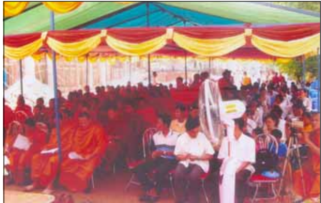
ទិដ្ឋភាពនៃការចូលរួមរបស់សមណនិស្សិត និស្សិតខ្មែរកម្ពុជាក្រោម

យើងខ្ញុំសូមតម្កល់ទុកនូវការចូលរួមឧបត្ថម្ភសម្រាប់បណ្តុះបណ្តាលធនធានមនុស្សដ៏ថ្លៃថ្លារបស់បងប្អូនខ្មែរកម្ពុជាក្រោមដែលនៅក្នុង និងក្រៅប្រទេសជាការបរិច្ចាគដ៏ខ្ពង់ខ្ពស់ដើម្បីបុព្វហេតុជាតិ សាសនា មាតុភូមិ និងការទប់ស្កាត់នូវការបាត់បង់ពូជសាសន៍ខ្មែរកម្ពុជាក្រោម ។ សំខាន់ជាងនេះ គឺរួមចំណែកក្នុងការជួយជំរុញឲ្យកុលបុត្រកុលធីតាខ្មែរកម្ពុជាក្រោម