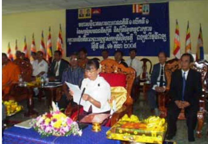
ព្រះអង្គម្ចាស់ក្សត្រីស៊ីសុវត្ថិ នារីមុនីពង្ស ទ្រង់ថ្លែងសុន្ទរកថាក្នុងអង្គសន្និបាត

សម្ព័ន្ធសមណនិស្សិត និស្សិតខ្មែរកម្ពុជាក្រោម (ស.ខ.ក.ក) ដែលមានទីតាំងនៅវត្តអង្គពោធិព្យាណ សង្កាត់ ស្ទឹងមានជ័យ ខណ្ឌមានជ័យ រាជធានីភ្នំពេញ បានប្រារព្ធអង្គ មហាសន្និបាតសាមញ្ញអាណត្តិទី ១ លើកទី ១ (អាណត្តិ ៤ឆ្នាំ) របស់ខ្លួន កាលពីថ្ងៃទី ១៥-១៦ ខែតុលា ឆ្នាំ ២០០៥ នៅវត្ត ព្រែកប្រា សង្កាត់ព្រែកប្រា រាជធានីភ្នំពេញ ក្រោមអធិបតីភាព ព្រះអង្គម្ចាស់ក្សត្រីស៊ីសុវត្ថិ នារីមុនីពង្ស និងមានសមាជិក សមាជិកា ព្រមទាំងភ្ញៀវភិក្ខុយសប្រមាណ ២០០ នាក់ ។ អង្គ មហាសន្និបាតប្រារព្ធឡើង ក្នុងគោលបំណងជ្រើសរើសថ្នាក់ ដឹកនាំថ្មីនៃ ស.ខ.ក.ក ព្រមទាំងសិក្សាទិសដៅទ្រទ្រង់ វប្បធម៌ និង ស្ថេរភាពខ្មែរនៅកម្ពុជាក្រោមបច្ចុប្បន្ន ។