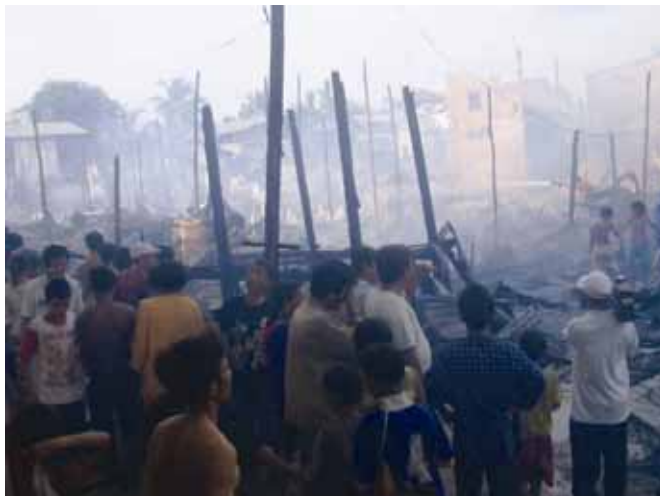
បងប្អូនប្រជាជន ឃុំស្រយាស្រែឈោរៈ ព្រោះផ្ទះសំបែងត្រូវភ្លើងឆេះបំផ្លាញគ្មានសល់