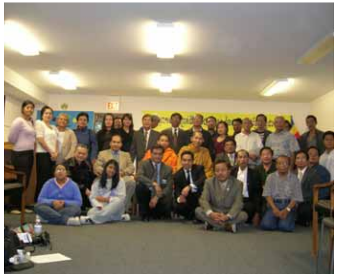
គណៈប្រតិភូ នៃសហព័ន្ធខ្មែរកម្ពុជាក្រោម

អស់រយៈពេលពេញមួយថ្ងៃក្នុងការជួបជុំ សហព័ន្ធបានពន្យល់ណែនាំដល់បងប្អូន ដែលកំពុងរស់ក្នុងរដ្ឋជីកាហ្គោនេះ អំពីបេសកកម្ម និង គោលបំណងរបស់សហព័ន្ធខ្មែរកម្ពុជាក្រោមទៅអនាគត ។ សហព័ន្ធខ្មែរកម្ពុជាក្រោម គឺជាអង្គការមួយដែលមិនសំដៅលើប្រាក់ចំណេញ គឺប្រយុទ្ធដោយអហិង្សាស្របទៅតាមច្បាប់នៃអន្តរជាតិ ដើម្បីគាំទ្រឲ្យមានសិទ្ធិមនុស្ស និងលទ្ធិប្រជាធិបតេយ្យ សំរាប់បងប្អូនខ្មែរក្រោមដែលកំពុងរស់នៅលើដែនដីកំណើតរបស់ខ្លួន ។ បងប្អូននៅជីកាហ្គោ មានសេចក្តីកក់ក្តៅយ៉ាងខ្លាំង នៅពេលដែលបានដឹងនូវចនាសម្ព័ន្ធនិងគោលបំណងរបស់សហព័ន្ធ ។ នៅក្នុងសុន្ទរកថានេះដែរ គណៈប្រតិភូបានរំព្រកអំពីទង្វើជិះជាន់ បំបាក់ជំនឿសាសនាសេរីភាពបញ្ចេញមតិ តែបន្តិចទៀតទំលាប់ និង វិស័យរៀនសូត្រពីសំណាក់អាណានិគមយួន ។ មិនតែប៉ុណ្ណោះ ធ្វើឲ្យខ្មែរក្រោមត្រូវពិការភ្នែកជាង ៣០០០ នាក់ តែពុំមានរដ្ឋាភិបាលណាមួយអើពើ ឬស្រាវជ្រាវឲ្យដឹងពីមូលហេតុឡើយ ។ល។ សុន្ទរកថានេះ ត្រូវបានបងប្អូននៅរដ្ឋជីកាហ្គោគាំទ្រ និងអបអរយ៉ាងខ្លាំង ។ បន្ទាប់ពីនោះ សហព័ន្ធក៏បានជ្រើសរើសសមាជិក