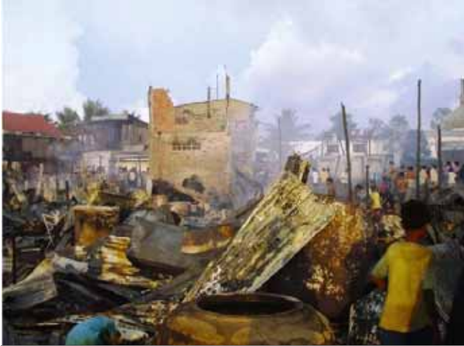
ទិដ្ឋភាពផ្ទះសំបែងត្រូវភ្លើងឆេះបំផ្លាញអស់

គ្រោះអគ្គិភ័យមួយបានកើតឡើង នៅភូមិសាមគ្គីសង្កាត់បុស្សីកែវ ខ័ណ្ឌបុស្សីកែវ រាជធានីភ្នំពេញ កាលពីម៉ោង ៣ រសៀល នាថ្ងៃទី ៩ តុលា ឆ្នាំ ២០០៥ កន្លងទៅនេះ ។