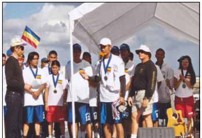
សន្ទូរកថារបស់កីឡាករទូកឯង នីស្សិតខ្មែរកម្ពុជាក្រោម