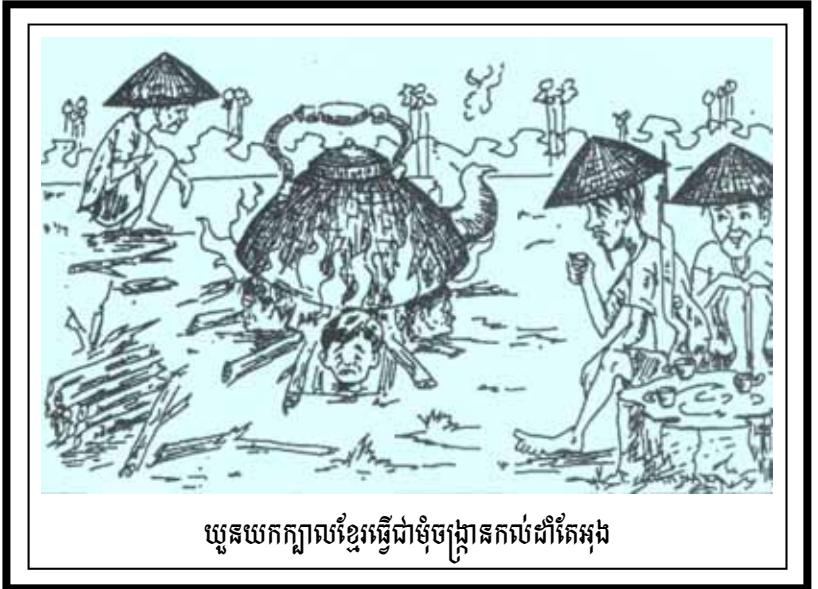
យួនយកក្បាលខ្មែរធ្វើជាម៉ូចផ្កាសកល់ដាំតែអុដ

ហួសក្តារយួនដាក់ កូនក្មួយលោកតាម ទៅទាំងពីរនាក់ យួនយល់ឃើញដាក់ ចូលទៅដូច្នោះ ។