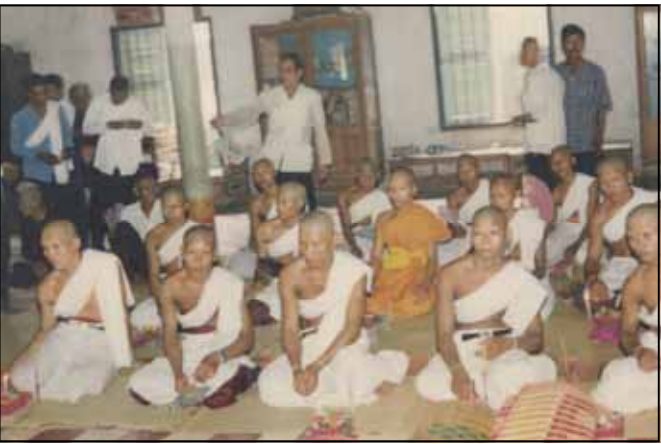
បួសនាគ នៅកម្ពុជាក្រោម

ព្រះអង្គបានបញ្ជាក់បន្ថែមទៀតថា ឯរឿងដែលខ្មែរ ភ្ញៀវស្រុកនោះ ព្រះអង្គគ្មានសមត្ថភាព ហាមឃាត់បានទេ រឿង នេះវាអាស្រ័យលើរដ្ឋាភិបាល បើប្រសិនបើរដ្ឋាភិបាលគោរព សិទ្ធិមនុស្សជាមូលដ្ឋាន រួមទាំងសិទ្ធិជាជនជាតិដើម ឲ្យបាន ត្រឹមត្រូវនោះ ប្រាកដជាគ្មានការភ្ញៀវស្រុក ហើយជនភ្ញៀវស្រុក ដែលបានរត់ទៅកម្ពុជាថ្មី ៗ នេះ ក៏ត្រូវប្រហែលជានឹងរឹលមក វិញដែរ ។