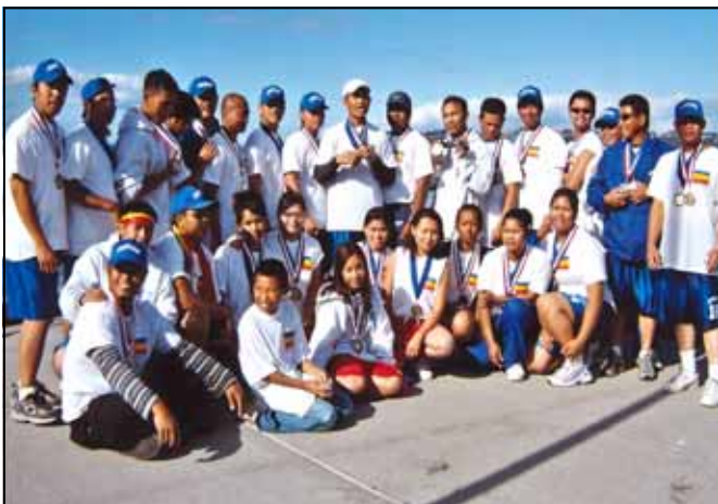
រូបថតអនុស្សាវរីយ៍ក្រុមកីឡាករទូកឯង នីស្សិតខ្មែរកម្ពុជាក្រោម