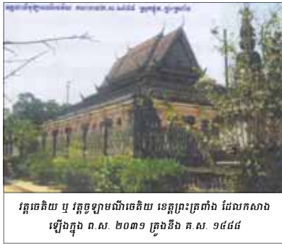
វត្តចេតិយ ឬ វត្តចូឡាមណីចេតិយ ខេត្តព្រះត្រពាំង ដែលកសាង ឡើងក្នុង ព.ស. ២០៣១ ត្រូវនឹង គ.ស. ១៤៨៨

តែជាអកុសលនៅក្នុងឆ្នាំ ១៨៦៣-១៨៩៣ សន្តិសញ្ញា បារាំងបានដាក់អាណានិគមលើប្រទេសខ្មែរ ហើយបារាំងបានយក កម្ពុជាក្រោមធ្វើអាណានិគម នៅពេលនោះបារាំងឃើញត្បូងកែវ ដ៏ល្អ នៅលើកំពូលស្តុបចេតិយគឺទាំងយប់ទាំងថ្ងៃយ៉ាងនេះ ពួកបារាំងក៏ បានបាញ់ទំលាក់កំពូលចេតិយឲ្យធ្លាក់ចុះមកក្នុងបំណងនឹងយកត្បូង កែវនោះ ប៉ុន្តែបារាំងមិនអាចយកត្បូងកែវទិព្វនោះបានទេ ។ ត្បូងកែវ ដែលធ្លាក់ចុះនោះ ក៏បានរិកិលខ្លួនចុះទៅក្នុងស្រះទឹកមួយនៅក្បែរ នោះបាត់ទៅ ពួកបារាំងក៏រុករកនៅសព្វទីកន្លែង តែរកពុំឃើញបាត់ រហូតមកទល់សព្វថ្ងៃនេះ ។ ហើយកន្លែងស្រះដែលត្បូងកែវបាក់ធ្លាក់ ចុះនោះ តាំងពីព្រះតេជគុណព្រះសង្ឃមុន ៗ ក៏ដូចជាបច្ចុប្បន្នព្រះអង្គ តែងតែផ្តាំមិនឲ្យព្រះសង្ឃ ឬ នរណាម្នាក់ទៅដឹកគាស់ កាយ ឬបាក់ សម្រាម ឬ ធ្វើអ្វីពុំសមរម្យនៅទីកន្លែងនោះបានឡើយ ។