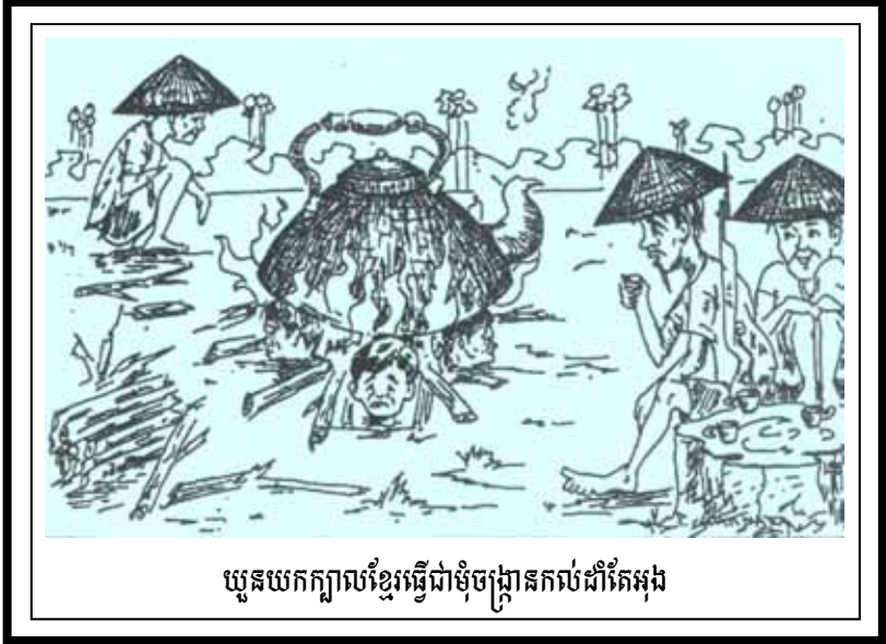
យូនយកក្បាលខ្លួនធ្វើជាម៉ូចប្រៀបគ្រប់ដំរីតែអុដ

១៤៤-រកប្បកដោគជ័យ ល្អល្អៈប្រពៃ ពេកពិតតត្រង់ ត្រេចបានពេលា ដាក់ដាក់គ្នា ត្រេចសោយរាជ្យត្រង់ ក្រុងកម្ពុជា ។ ១៤៥-អស់មកមន្ត្រី ធំតូចផងក្តី គង់គាល់ត្រៀបត្រា ផ្គុំភ្លេងរំលឹក សូរស័ព្ទសមគ្នា ពាលពាលអាសារ សម្រាប់ច្រើនត្រៃ ។ ១៤៦-លេងភ្លេងមហោស្រព នៅល្បែងផងគ្រប់ ជួបប្រាំពីរថ្ងៃ ទើបអស់ព្រាហ្មព្រិទ្ធ បរោហិតសាយសៃ ផ្គុំស័ង្ខជាញជ័យ ផ្ទាយព្រះនាម្នា ។ ១៤៧-ឡើងព្រះនាមនាដ្ឋ សម្តេចព្រះបាទ ឧទេរាជា គ្រប់គ្រងមន្ត្រី សេណីសេណា ក្រុងកម្ពុជា បូរីរាជស្ថាន ។ ១៤៨-រាស្ត្ររឹងសុកល ភូមិកពមណ្ឌល សប្បាយក្សេមក្សាន្ត អង្គឥតសត្រូវ ណានិងបៀតបៀន បទបុណ្យក្សត្រក្សាន្ត គ្រប់គ្រងបូរី ។ ១៤៩-ឯពញាយោមរាជ សៀមសុទ្ធាងរាង ជាធំធេងបតី បំរើពុទ្ធិចៅ ចេញទៅរឹងខ្ចី អព្វត្បែសក្តី សឹងទៅទាំងអស់ ។ ១៥០-អព្វត្បែសនោះ ទុកកូនមួយឈ្មោះ ម្នាជាចោងប្រស ឲ្យនៅមើលផ្គុន ថែផ្គុនគឺបខុស បទបងជាប្រស ខុសគ្នាមើលគ្នា ។