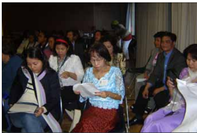
ស្ត្រីខ្មែរក្រោម នៅក្នុងអង្គការសហប្រជាជាតិ នាថ្ងៃទី ០៨ មីនា ២០០៥

ថ្វីបើនារីនៅលើសកលលោកធ្វើចលនាតស៊ូទាមទារនូវសិទ្ធិនារី ជិត ១០០ ឆ្នាំ ហើយរដ្ឋាភិបាលជាច្រើននៅលើពិភពលោក ក៏