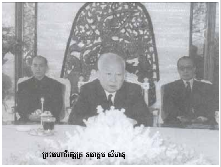
ព្រះមហាក្សត្រ នរោត្តម សីហនុ

នៅក្នុងអត្ថបទព្រឹត្តិបត្រព័ត៌មាន ព្រះបរមរាជវាំង កាលពីថ្ងៃ ទី ១៧ ខែ មីនា សម្តេចឪដែលគ្រោងយាង ត្រឡប់មកកាន់ប្រទេសកម្ពុជានៅខែមេសា បានមានព្រះរាជ បន្ទូលពន្យល់អំពីប្រវត្តិនៃដោះទឹកដីកម្ពុជាក្រោម ចាប់តាំង ពីឆ្នាំ ១៨៦០ នៅពេលដែលកងទ័ពអាណានិគមបារាំងធ្វើ សង្គ្រាមដណ្តើមកាន់កាប់ទឹកដីកម្ពុជាក្រោម រហូតមកដល់ ពេលនៃការសម្រេចប្រគល់ទឹកដីនេះ ទៅឲ្យប្រទេសវៀត- ណាម ។