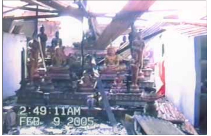
ព្រះពុទ្ធបរិស័ទវត្តសាមគ្គីរដ្ឋ នៅរាជធានីភ្នំពេញ ដែលត្រូវកម្លេច ដោយអគ្គីភ័យ

បន្ទាប់មកនៅថ្ងៃទី ០៣ មីនា ព្រះសុមេធាធិបតី ទេព វង្ស សម្តេចព្រះសង្ឃរាជគណៈមហានិកាយ នៃព្រះរាជាណាចក្រកម្ពុជា អមព្រះរាជដំណើរដោយមន្ត្រីរាជការជាច្រើនរូបទៀត បានពាំនាំនូវ ចតុបថ្វីយ ដែលជាព្រះរាជអំណោយរបស់សម្តេចផ្ទាល់ និងជារបស់