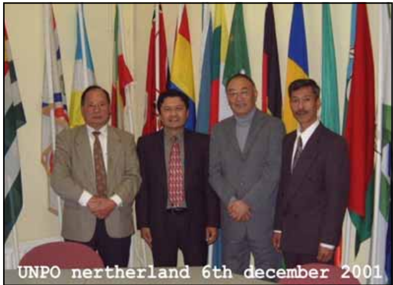
មេដឹកនាំសហព័ន្ធខ្មែរកម្ពុជាក្រោម ក្នុងអង្គសន្និបាត យូអិនភីអូ លើកទី ៦ - ០៦/១២/២០០១

លោក ស៊ីន ទូន ប្រធានប្រតិបត្តិ សហព័ន្ធខ្មែរកម្ពុជាក្រោម បានផ្ញើសារលិខិតមួយឆ្ពោះតម្រង់ទៅ សេតវិមាន កាលពីថ្ងៃទី ១៣ ខែធ្នូ ឆ្នាំ ២០០៣ ក្នុងឱកាសទ័ពពិសេសរបស់សហរដ្ឋអាមេរិក ប្រមាញ់ចាប់បានមេដឹកនាំផ្តាច់ការ ប្រល័យពូជសាសន៍សាដាម ហ្វីសេន ។