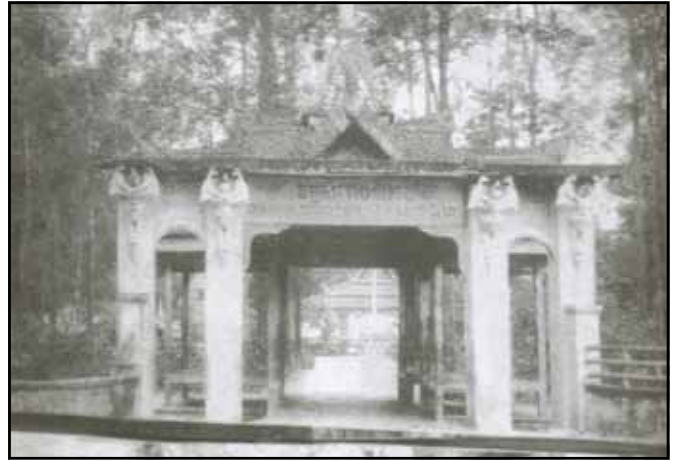
វត្តសំរោងឯក កសាងនៅ ព.ស. ១១៤៦ គ.ស. ៦៤២

វត្តសំរោងឯក ត្រូវបានកសាងឡើងមុនគេបង្អស់ នាចុងសម័យនគរភ្នំ និងដើមយុគសម័យចេនឡា ក្នុងគ.ស. ៦៤២ ក្នុងរជ្ជកាលព្រះបាទភវវរ្ម័ន (៦៣៥-៦៥៥) គឺនៅពេលដែលព្រះអង្គយាងត្រឡប់ពីធ្វើសឹកសង្គ្រាម យកប្រទេសចាមធ្វើជាចំណុះប្រទេសខ្មែរប្រកបដោយជោគជ័យ ហើយបានត្រាស់បង្គាប់ឲ្យពួកមេទ័ព បោះព្រះពន្លាជ័យនៅលើទួលដើមសំរោង ក្បែរត្រពាំងមួយ ។ ពេលផ្តួសម្រាក នៅលើទួលនោះ ព្រះអង្គបានសុបិនឃើញព្រះពុទ្ធបដិមាមួយអង្គ ផុសឡើងនៅត្រង់គល់ដើមសំរោងមួយ លុះព្រះអង្គភ្ញាក់តើនឡើង ព្រះអង្គត្រាស់បញ្ជា ឲ្យពួកមេទ័ពដឹកកាយត្រង់កន្លែងសុបិន ឃើញព្រះពុទ្ធបដិមាផុសឡើង នោះក៏ប្រទះឃើញពុទ្ធបដិមាសិរិទ្ធិទ្រង់គង់ព្រះភ្នែក កម្ពស់ ១,២ ម ព្រះអង្គក៏រៀបចំកសាងវត្តមួយនៅលើទួលសំរោងតែម្តងទៅ ។